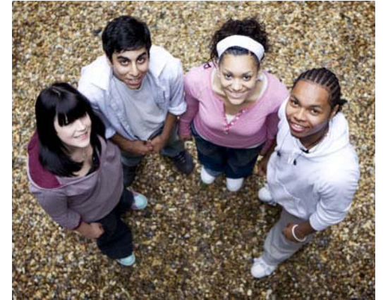
三藩市青年委員會已獲得版權許可

三藩市警察局尋求與家庭、學校和青年服務提供者合作，共同防止和解決影響兒童和青年的問題。